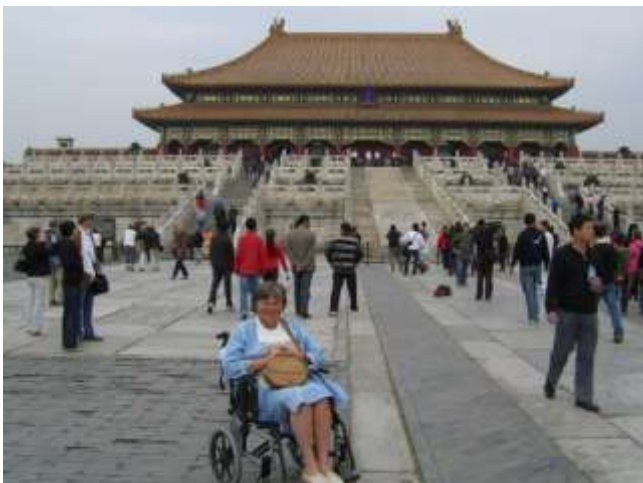
I oktober gjorde vi en fantastisk resa till Kina