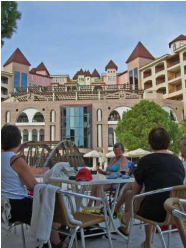
I september var gjorde vi den sedvanliga resan med familjen Kährström till Turkiet.